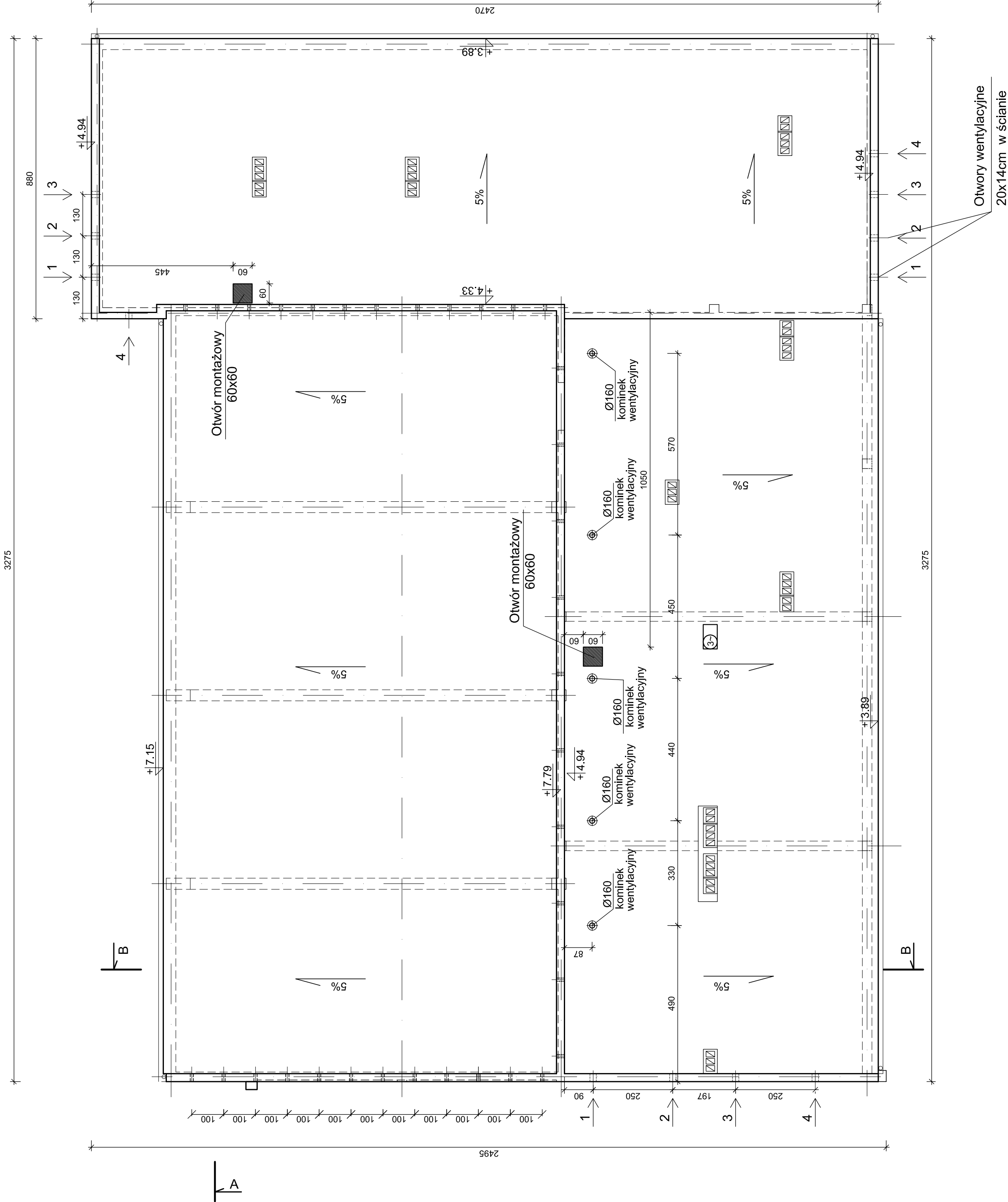
RZUT DACHU - SEGMENT "D" SKALA: 1:100